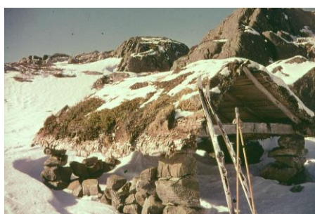
Høløpe på Krogjen, tilhørte bruket til Elling Skjæveland. Foto Per Spødevold 1961.