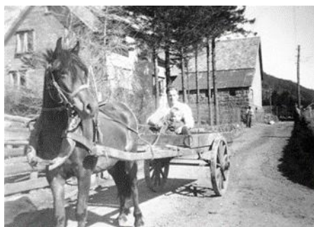
Bilete med hest og mjelkekjerre er frå garden til Ola Skjæveland og guten er kanskje Einar.