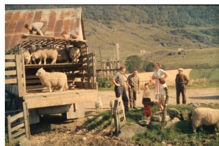
Heim med sauer fra Kvævemoen 1963. Avlesing i gardsrommet til Toralf Søyland.